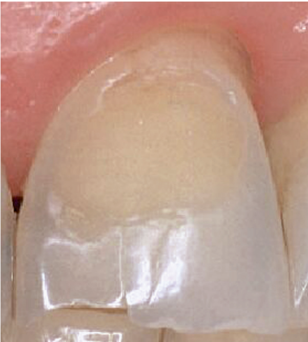
Klassische Erosion an der Außenfläche des oberen linken Schneidezahns. Typisch sind die Muldenform und der intakte Zahnschmelz am Zahnfleischrand.

Erosionen sind Zahnschäden, die durch den direkten Kontakt eines sauberen Zahnes mit Säuren entstehen. Die Säuren können Mineralien aus der Zahnoberfläche herauslösen, wodurch Zahnschmelz abgetragen wird und Defekte auf der Zahnoberfläche entstehen.